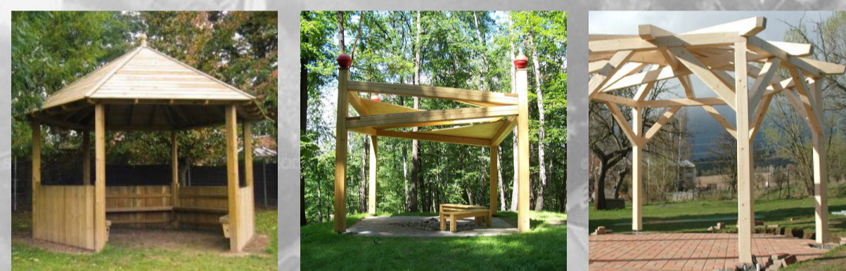
Altán, pergola na začátku a na konci parku