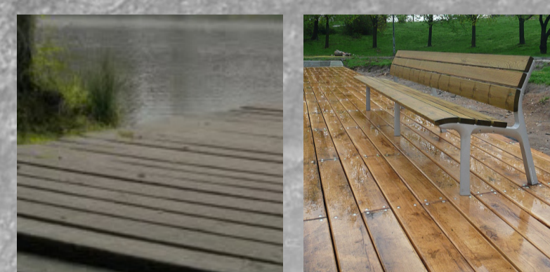
Tůňka s odpočinkovým molem