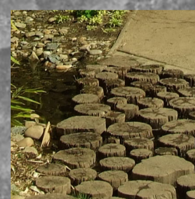
Přechod přes potok