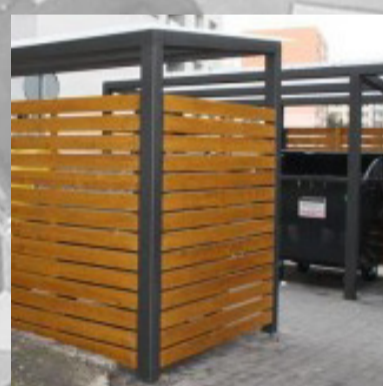
Krytá kontejnerová stání