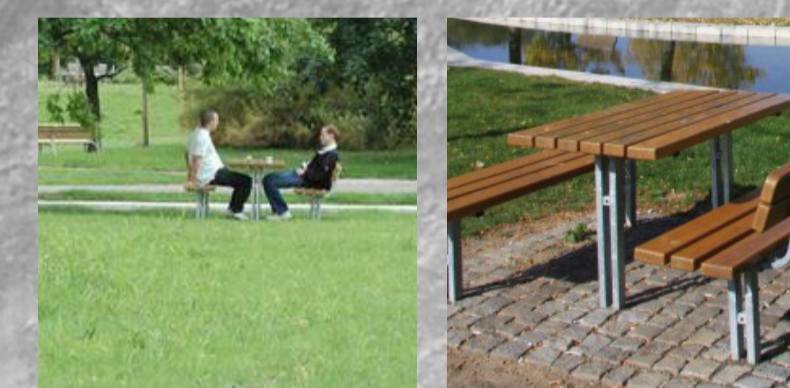
Piknikové lavičky se stoly