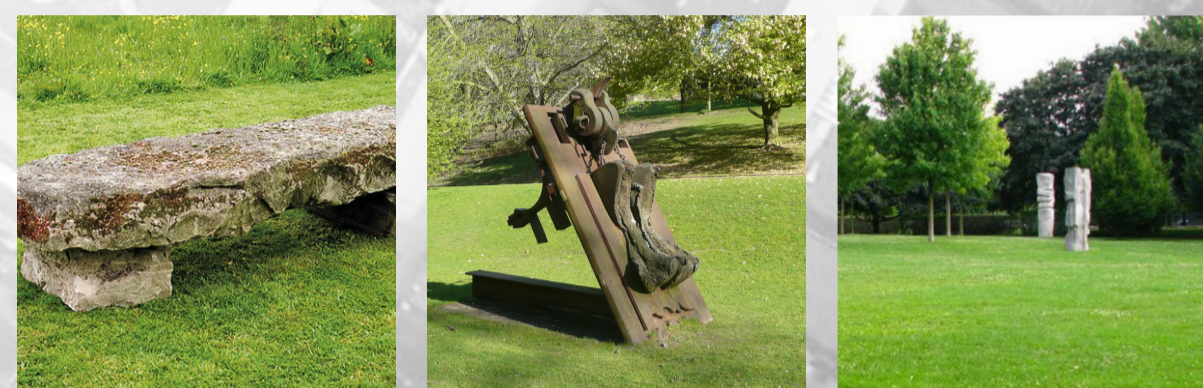
V prostoru rozptýlené solitérní objekty- umělecká díla, menhiry