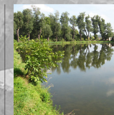
Rekreační plochy u rybníka