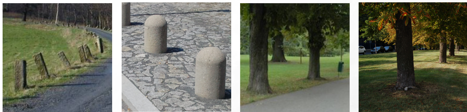
Vymezení parku vůči přiléhajícím komunikacím- palníky, stromořadí