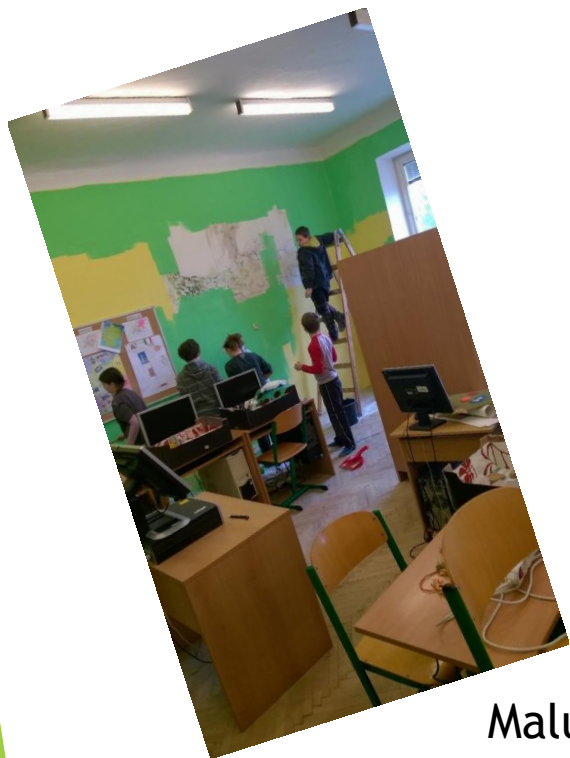
Malujeme si třídu - 5.A