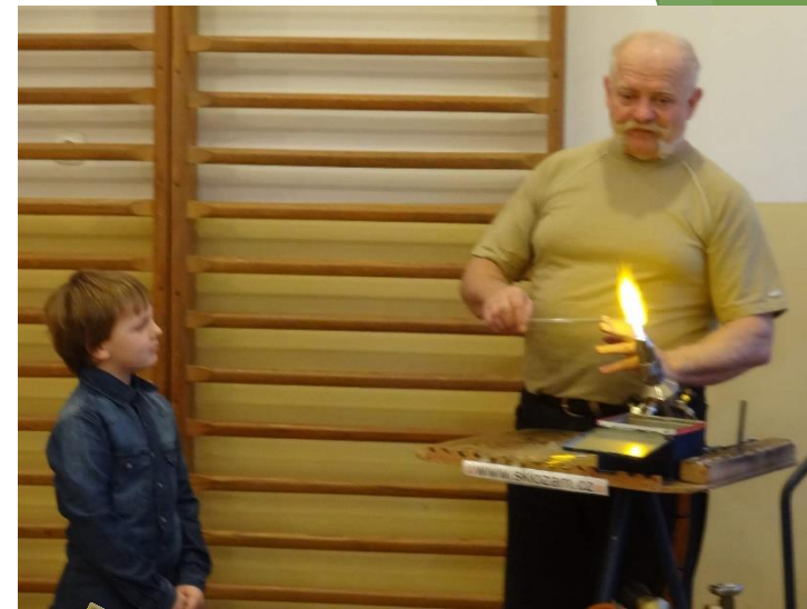
Sklář ve škole