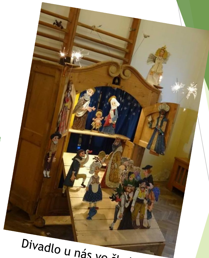
Divadlo u nás ve škole