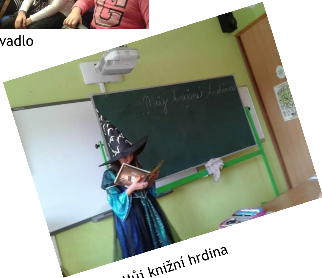
Můj knižní hrdina