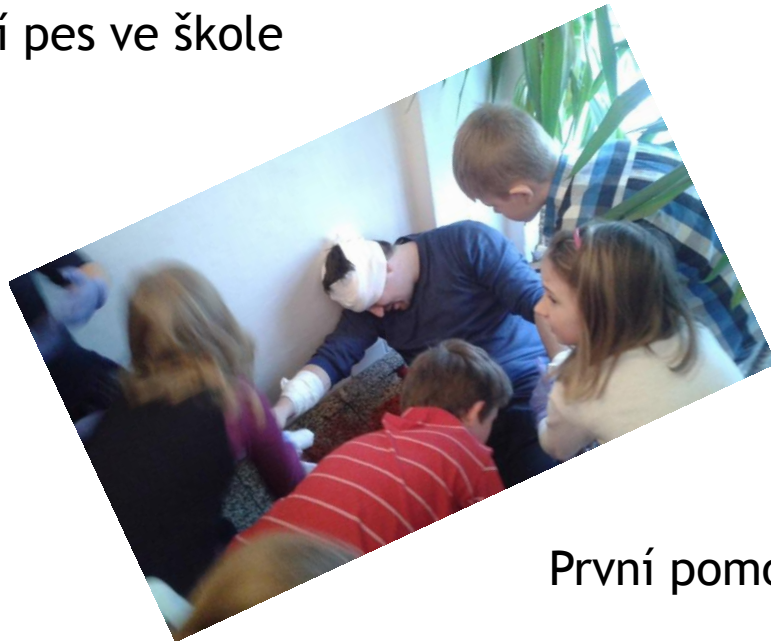
První pomoc - projektový den