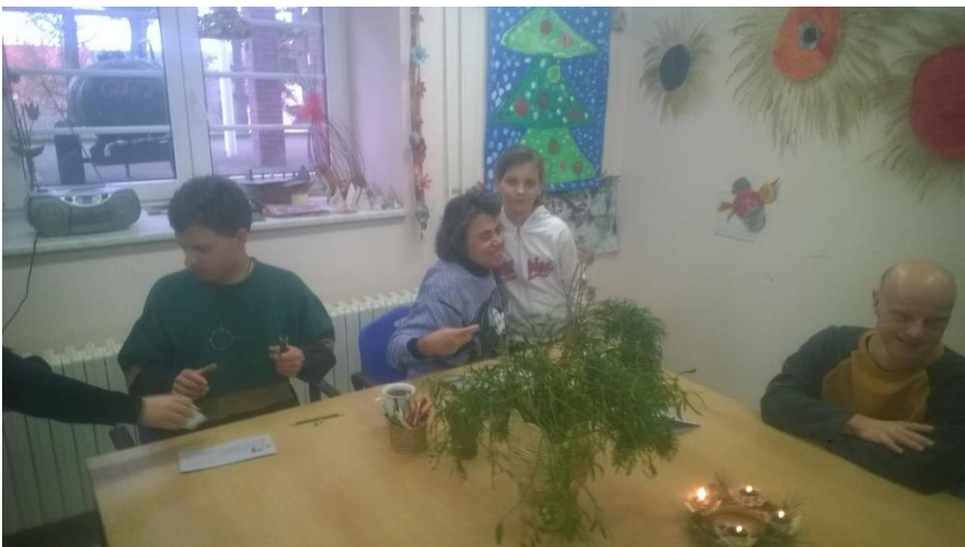
Vánoční návštěva v Laguně