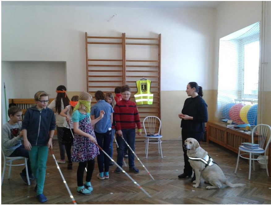
Vodící pes ve škole