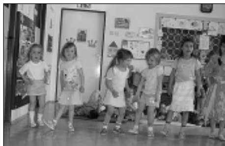
Nejmenší s nadšením tancují