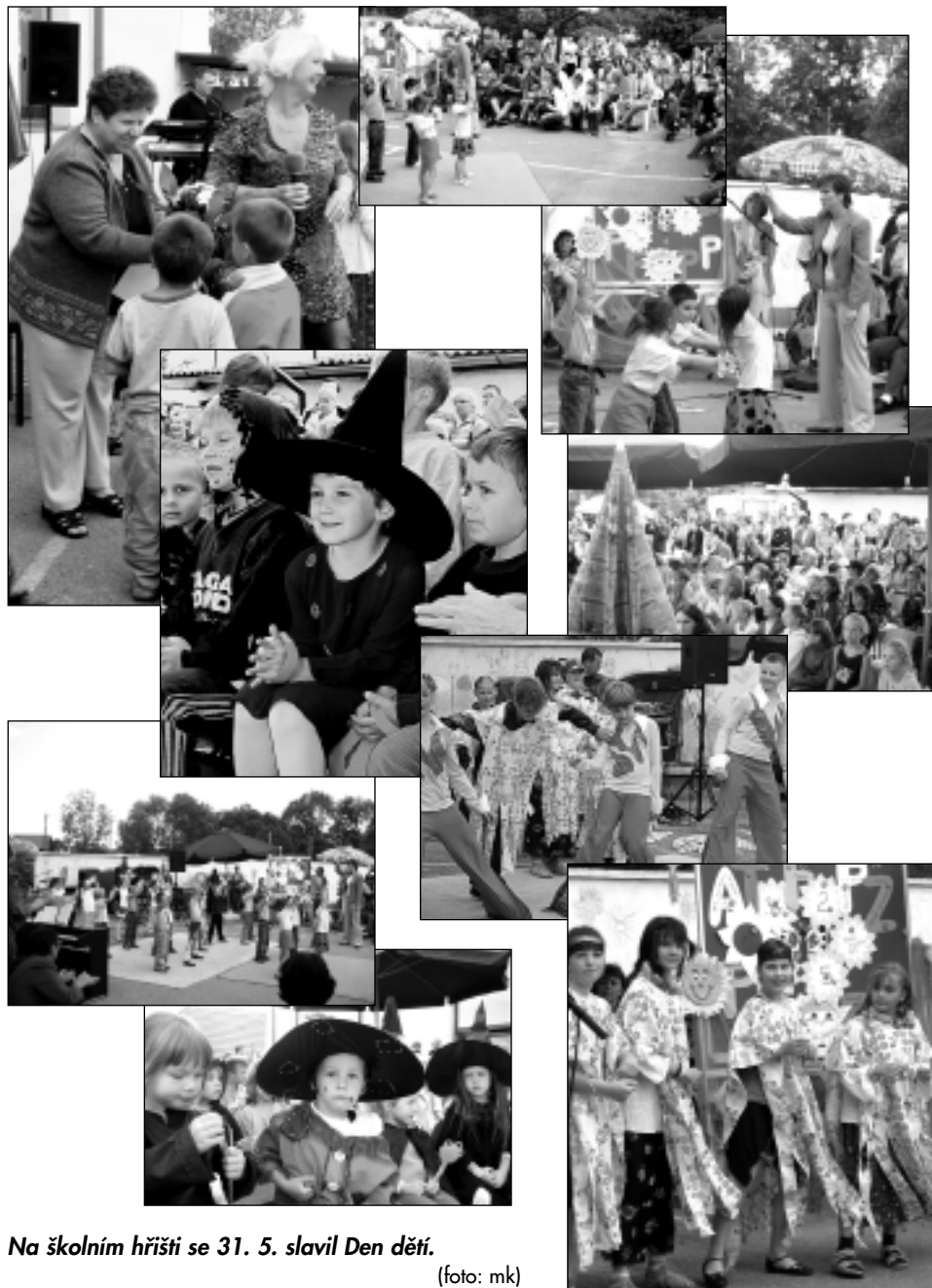
Na školním hřišti se 31. 5. slavil Den dětí.