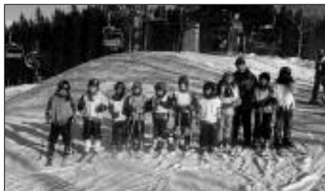
Kopec Aldrov ve Vítkovicích zdolávaly děti ze 2. – 5. třídy skvěle

ÚNOROVÉ PSANÍ ze zasněžených plání Jizerských hor a Krkonoš si četla vrána Jiřina se skřítkem Školníčkem, když byly děti na škole v přírodě. Bezděně si tam zalýžovaly, a to dokonce i na večerním lyžování. Ta jim záviděla! Jenže na těch jejich pařátkách jí lyžičky nedrží, ať se snaží, jak chce.