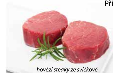
hovězí steaky ze svičkové