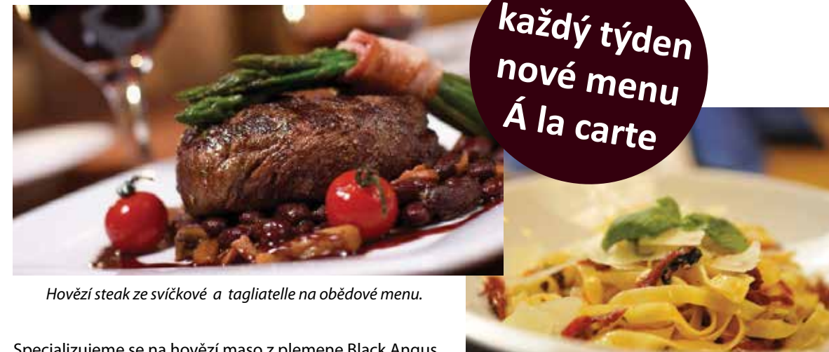
Hovězí steak ze svičkové a tagliatelle na obědové menu.

Specializujeme se na hovězí maso z plemene Black Angus.