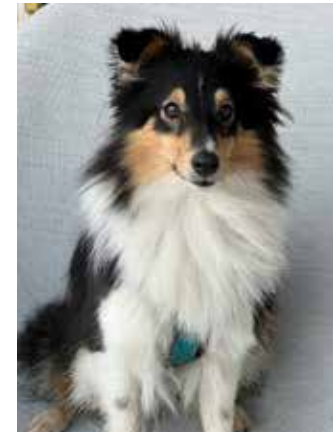
Ahoj, Jmenuji se Chelsea a jsem maskotem naší redakce. Chodím sem s paničkou pravidelně a stará se redaktorům o rozptýlení. Bavi mě hlavně večere, ale nepohrdnu ani obědem.